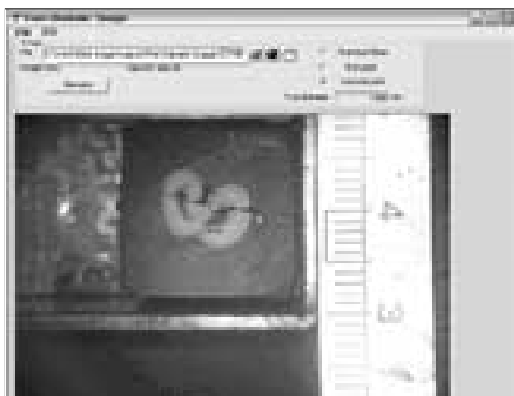
Figure 2. Computer program, measuring minimum wall thickness.