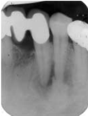
Figure 1. Periapical view of left mandibular canine (2003. 3. 13.).