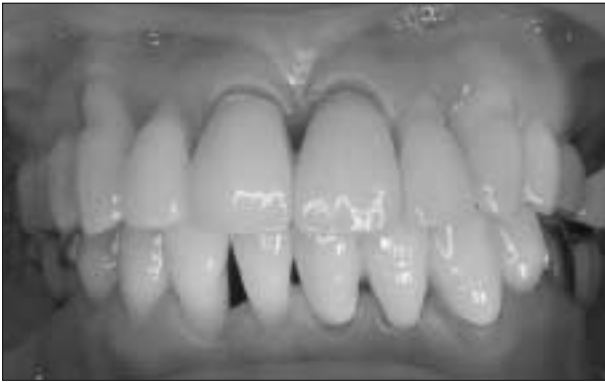
Figure 3. PFG bridge on #31-#33

방사선 사진 검사 상 #33과 #34의 치근단 부위에 방사선 투과성 병소가 관찰되었으며 #34 치근단 부위에는 방사선 불투과성 양상도 관찰되었다 (Figure 1). 임상 검사 상으로