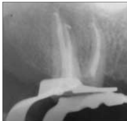
Figure 4-C. Endodontic treatment.