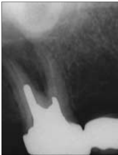
Figure 4-A. Diagnostic intraoral radiograph.

Allen 등 2) 의 보고에 의하면 비외과적인 치료의 성공률은 72.7%, 외과적인 치료는 60%정도의 성공률을 보인다고 하였으며, Grung 등 3) 과 Hepworth와 Friedman 4) 의 보고에서도 비외과적인 치료가 더 높은 성공률을 보인다고 하였다. 또한 재근관치료를 할 때 감염의 주원인인 세균을 근관 내에서 제거하는 것이 우선 되어야 하며 감염균의 제거 없이 시행된 치근단 수술은 결과적으로 다시 실패할 것이다. 따라서 치근단 수술을 시행하기 전에 먼저 통상적인 근관치료가 가능한가를 먼저 검사하여야 하며 가능하다면 비외과적인 시술을 통한 치료를 우선적으로 선택하여야 할 것이다. 치관부로의 접근을 방해하여 사실상 근관치료를 어렵게 만드는 것들 중 임상에서 자주 직면하는 것이 근관내 포스