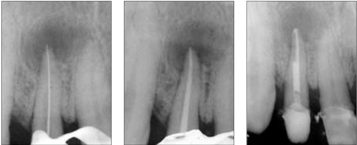
Figure 2-C. Endodontic treatment.

거 후 통상적인 근관치료로 근관장 측정, 세정 및 성형, 근관충전을 한 후 fiber-reinforced composite post와 복합레진을 이용하여 코어를 형성하였다 (Figure 2-C).