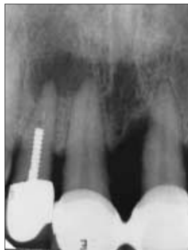
Figure 2-A. Diagnostic intraoral radiograph.

기존의 bridge를 제거한 후 포스트에 고속 #330 bur를 이용하여 구멍을 형성하고 ATD automatic bridge remover의 loop를 결찰하였다. 천천히 motor를 작동시켜 포스트를 근관내에서 제거하였다 (Figure 2-B). 포스트 제