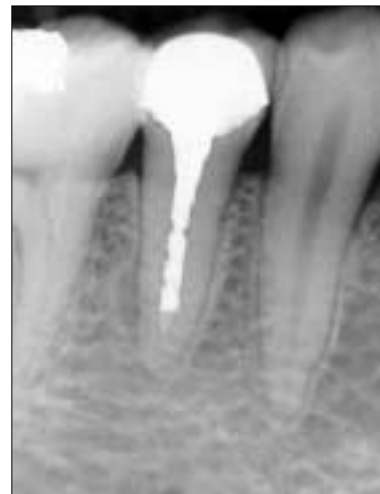
Figure 3-A. Diagnostic intraoral radiograph.

Crown을 제거하고 동일한 방법으로 포스트를 제거한 후 (Figure 3-B) 근관치료를 시행하였다.