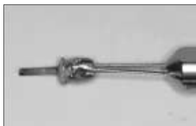
Figure 2-B. Post removal procedure.