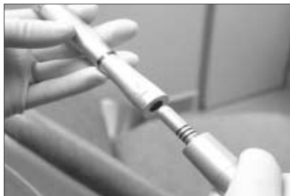
Figure 1. ATD automatic bridge remover.