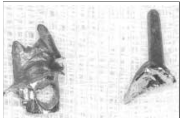
Figure 4-B. Post removal.