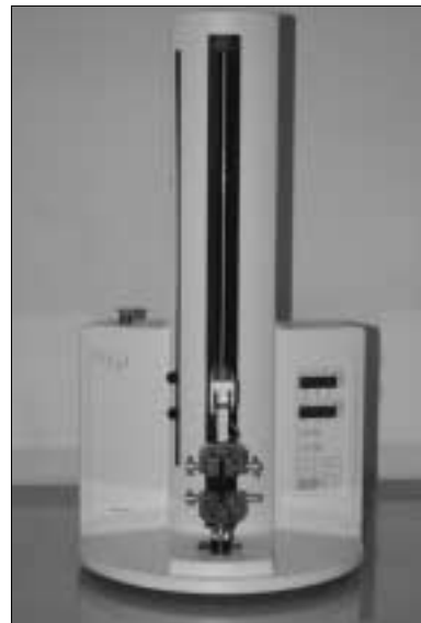
Figure 2. EZ test for microtensile bond strength test

미세인장 결합강도를 측정하기 위하여 각 시편을 testing apparatus에 위치시키고 시편의 양쪽 끝을 cyanoacrylate adhesive로 접착하였다 (Figure 1). Universal testing machine (EZ test, Shimadzu Co., Kyoto, Japan, Figure 2)을 이용하여 상아질과 복합레진의 결합계면이 파절될 때까지 crosshead speed 1.0 mm/min으로 인장 하중을 가하였으며, 파절 시의 하중 N (Newton)은 MPa로 환산하였다.