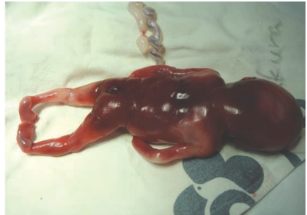
Fig. 2. Photograph of terminated fetus showing bilateral club foot and meningocele.

18번 염색체가 관여하는 세포유전학적 이상은 비교적 흔한 편이며 주로 세염색체나 말단 결실의 형태로 나타난다[8]. 이에 비해 상염색체가 쌍중심절염색체 형태로 나타나는 경우는 매우