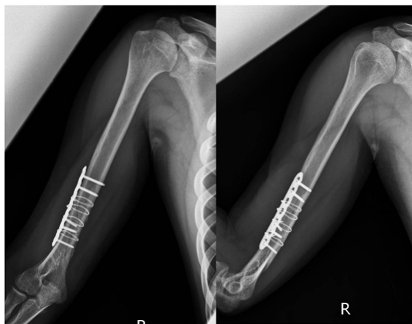
Fig. 3. Follow-up radiographs 6 months after operation shows well healing without complication.

의 신경 증상은 없었으며, 장상지 석고 부목을 4주간 시행 후 환부 안정화를 확인하고 8주간 주관절 보조기 착용 하 관절 운동 등의 재활 치료를 시행하였다. 술 후 6개월 경 시행한 방사선 사진 상 골절 부 유합 소견 관찰되었고(Fig. 3), 술 후 1년 6개월 경 금속제거술 시행하였다(Fig. 4). 2년 추시 상 주관절의 운동 범위는 굴곡 제한 0도, 후속 굴곡 130도로 관찰되었으며, 일상생활에 불편함 없이 지내고 있다.