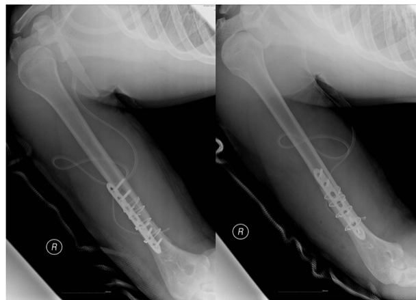
Fig. 2. Postoperative radiographs shows precise reduction and stable fixation with plate and wiring.

의 신경 증상은 없었으며, 장상지 석고 부목을 4주간 시행 후 환부 안정화를 확인하고 8주간 주관절 보조기 착용 하 관절 운동 등의 재활 치료를 시행하였다. 술 후 6개월 경 시행한 방사선 사진 상 골절 부 유합 소견 관찰되었고(Fig. 3), 술 후 1년 6개월 경 금속제거술 시행하였다(Fig. 4). 2년 추시 상 주관절의 운동 범위는 굴곡 제한 0도, 후속 굴곡 130도로 관찰되었으며, 일상생활에 불편함 없이 지내고 있다.