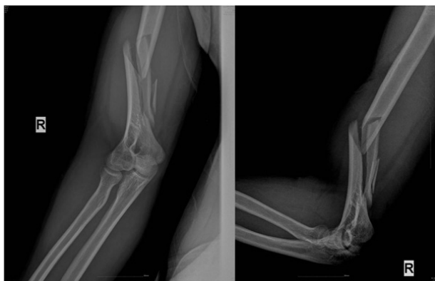
Fig. 1. Initial radiographs of comminuted spiral fracture with butterfly fragment in distal humerus due to arm wrestling in a 22-year-old man.

내원 당시 시행한 단순 방사선 사진 상 우측 상완골의 원위 골간부에 나비형 골편(butterfly fragment)을 동반한 나선 골절(spiral fracture)이 관찰되었다(Fig. 1). 일반적인 팔씨름 이후 발생하는 상완골의 골절과는 다른 형태를 보여 병적 골절 등의 병변을 확인하기 위해 자기 공명 영상(magnetic resonance images)을 시행하였다. 골절부 주위의 수강(medullary canal) 내의 액체 저류, 주위 연부 조직의 혈종 및 종창 이외에 특이 소견은 관찰되지 않았으며, 수술 시 골절부 조직에 대한 생검을 시행하였으나 특이 병변은 발견되지 않았다. 골절에 대하여 저 접촉성 압박금속판(LCDCP, low contact dynamic compression plate) 금속판 및 분쇄 편에 대해 와이어링(wiring)을 사용하여 내고정을 시행하였다(Fig. 2). 술 후 원위부