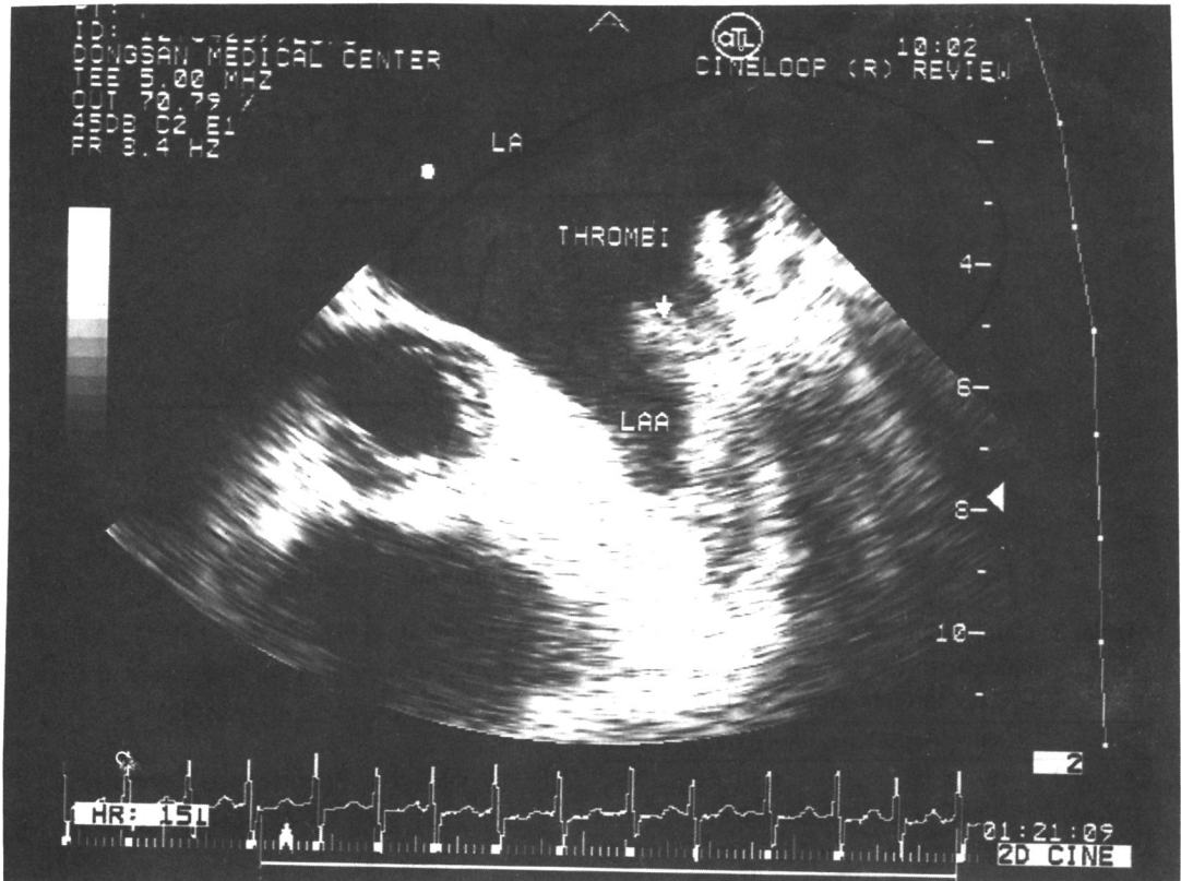
Fig. 1. Transesophageal basal short axis of the left atrium of the level of the appendage in a patient with mitral value prosthesis. The cavity of appendage appears almost completely filled by mural thrombus (arrow).

square test, 다변량 판별분석을 이용하여 상기 여러 인자와 혈전증과 SC의 관계를 알아보고 p값이 0.05 이하시 통계적 유의성이 있는 것으로 처리하였다.