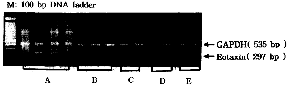
Fig. 1. RT-PCR for eotaxin and GAPDH mRNA in bronchial tissues. *A~E : subjects group.