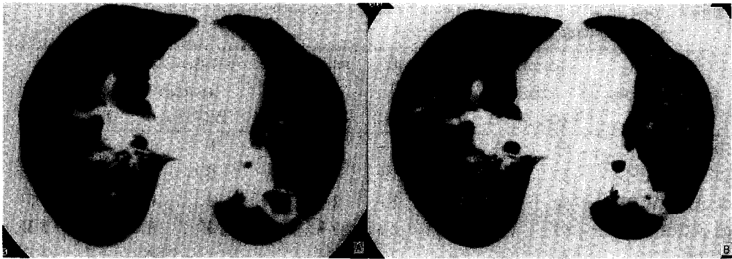
Fig. 2. Changes of chest CT findings in actively caseating type of endobronchial tuberculosis before(a) and after(b) treatment There were marked improvement in bronchial narrowing and peribronchial cuffing, and contraction of cavity after one month of anti-tuberculosis treatment