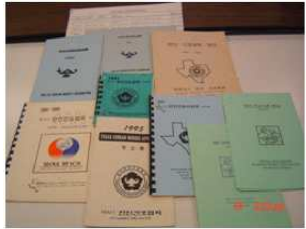
〈Figure 2〉 Directories-North Texas Korean American Nurses

북 텍사스 한인간호사회 회원들은 지역 한인교민들의 복지, 건강, 교육, 교민들간의 결속, 의료 봉사, 국내외 간호계 발전을 위한 후원, 교육 및 출판 등의 매우 다양한 활동을 펼쳤다. 의료봉사 활동으로서서는 한인회 행사에서 응급처치 봉사(American Korean Immigrant History, 2005; Dallas Korean Nurses, 1983)와 예방접종 및 건강검진을 시행하였다. 또한 한인들이 미국 내 의료기관을 이용하는데 필요한 정보를 제공하고 병원에 입원한 한인환자를 위한 통역 및 교통편을 제공하는 자원봉사를 하여 왔다. 특히 독감 예방주사 접종, 그리고 한인 여성들의 유방암 예방 및 조기 발견을 위한 무료 Mammogram 검사와 한인 남성들을 대상으로 한 전립선 암 예방을 위한 검사를 매년 실시하여 그동안 100-300여 명의 한인들이 혜택을 받았다(Benefits of