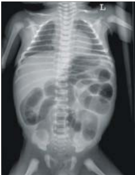
Fig. 1. Plain abdominal film revealed multiple dilated loop of small bowel.

환아는 수술 후 꾸준히 장 확장 소견 완화를 보이고 C-반응성 단백질도 감소하면서 호전 보였고 6병일부터 수유 시작하였다. 제10병일에 수술 부위의 염증이 발생하여 제 15병일에 부분적인 재봉합이 시행되었다. 이후 제 21병일에 완전히 호전되어 퇴원하였다.