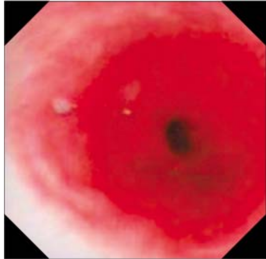
Fig. 4. Four weeks later, follow up endoscopic finding shows disappearance of ulcers and white plaques.