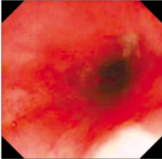
Fig. 2. Endoscopic finding shows a couple of deep and shallow ulcers with white plaques in the lower esophagus.