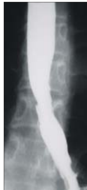
Fig. 1. Barium esophagogram shows typical irregular mucosal ulceration with diffuse luminal narrowing of the lower esophagus.

치료 및 경과: 상부 위장관 내시경 검사로 식도 칸디다증을 진단하였고 조직 검사에서 이를 확인하였다. Fluconazole과 proton pump inhibitor (PPI)를 사용하여 증상이 소실되었으며, 입원 10병일에 퇴원