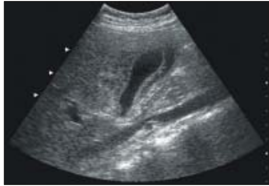
Fig. 2. Abdominal ultrasonogram showed hepatomegaly and gall bladder wall thickening.