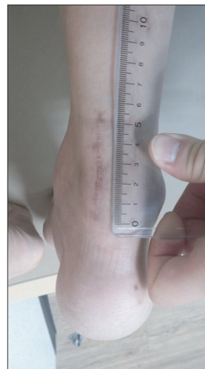
Figure 2. Mean length of the incision for Achilles tendon repair was 5.7 cm.