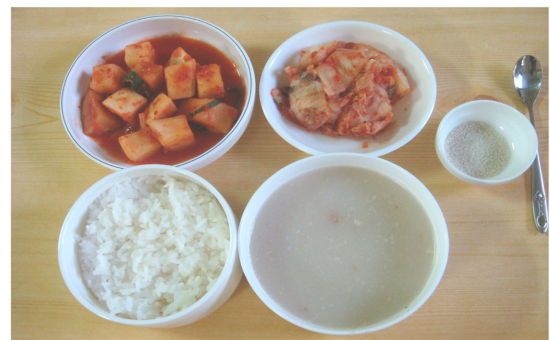
Fig. 2. Picture of the meals served as lunch.

식사 시작 전 연구대상자에게 한 입 분량 당 한 숟가락의 밥을 입에 넣고 씹기 시작하면서 음식을 완전히 삼키기까지의 저작횟수를 기록할 수 있는 기록지를 제공하여 기록하게 한 후 식사 종료 후 기록지를 수거하였다. 식사시간은 연구대상자 각각의 휴대폰 stop watch를 이용하여 식사 시작시간과 종료시간을 기록하도록 하였으며, 한입 분량은 총 섭취량을 총 숟가락수로 나누어 계산하였다. 음식섭취속도는 분당 섭취한 음식의 양으로 연구대상자가 원하는 양만큼의 음식을 평상시대로 섭취하게 한 후 총 섭취량을 식사 시 소요된 시간으로 나누었으며, 식사섭취량은 식사종료 후 연구자가 연구대상자에게 제공된 양에서 섭취 후 남은 양을 차감하여 산출하였으며, 식사 시 물은 200 ml 안에서 자유롭게 섭취하도록 하였다[25].