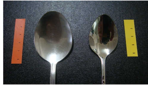
Normal spoon and small spoon

연구대상자들에 실험 전날은 심한 운동과 과식을 피하고 술을 마시지 않도록 권고하였으며, 실험 당일 아침은 평소와 비슷한 식사를 하도록 교육시켰고, 실험 당일 점심식사 3시간 전부터 열량이 있는 식품이나 음료의 섭취를 그리고 점심식사 1시간 전부터는 물의 섭취도 제한하였다. 점심식사로 제공된 실험식은 12시에서 12시 30분에 사이에 제공하였으며, 식사동안 독서와 대화 등 식사에 방해되는 다른 일을 병행하지 못하도록 하였다. 실험 첫 날, 실험식을 제공하기 전에 평소 식습관에 관한 설문조사를 실시하였고, 1일 식사 횟수, 밥과 국의 섭취량, 식사 시작과 종료시점, 평소의 저작 습관, 음식을 한입 섭취 시 저작횟수, 숟가락으로 음식을 섭취 시 한입의 양 등의 내용으로 구성된 설문지를 연구대상자가 직접 작성하였다.